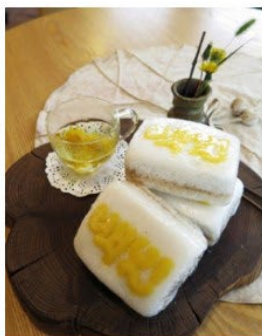
모양 꿀백설기 30ea