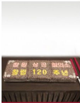
창원상공회의소 창립 120주년 떡 절단식

The 120th Anniversary of the Changwon Chamber of Commerce and Industry Cutting