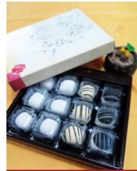
수능 찰쌀떡 세트