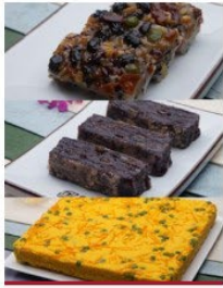
인기 3종 세트