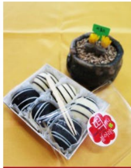
수능 초코 찰쌀떡 4호