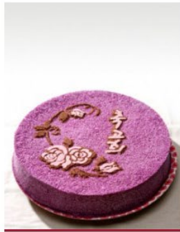
자색 고구마 케익