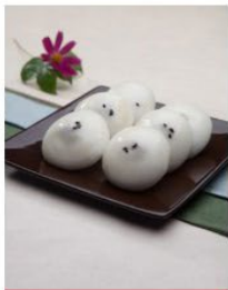
몽실몽실 증지떡 (증편)