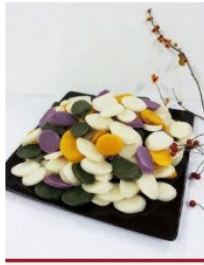
4색 떡국 떡