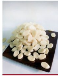
우리 쌀100% 떡국떡