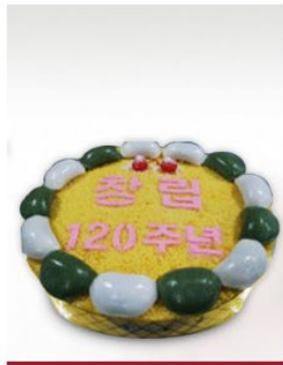
창원상의 창립 120주년 회원사 케익

The 120th Anniversary of the Changwon Chamber of Commerce and Industry Cutting