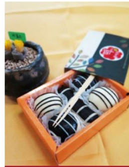
수능 초코 찰쌀떡 3호