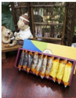
인기 3종 답례 세트