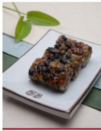
모듬 영양 찰떡