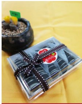
베베로 찰떡 4호