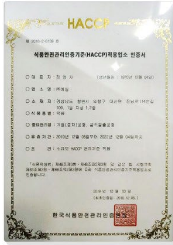
HACCP 적용업소 인증서 HACCP Applied Business Certificate