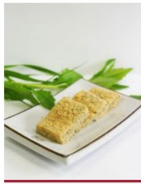
수리취인절미 (단오날 먹는떡)

Three meals a day (three sets of health)