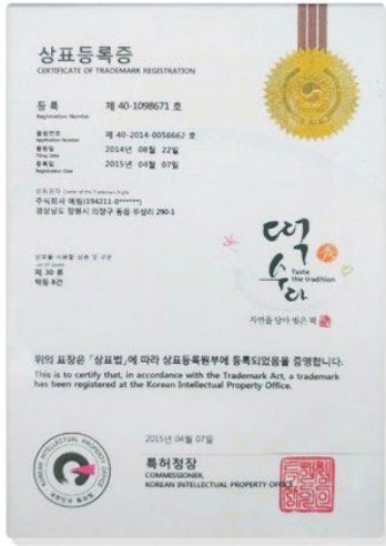
상표등록증 trademark registration card