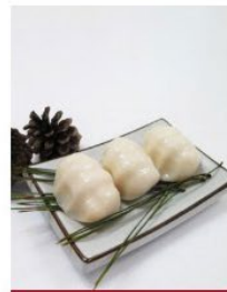
집에서 찌먹는 녹두왕송편