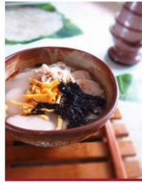
야채 품은 현미떡국 떡